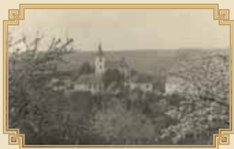
kostel Narození Panny Marie

15. května biřmování – od sochy sv. Josefa (křížovatka u Šamlerů) vyšel průvod do kostela.