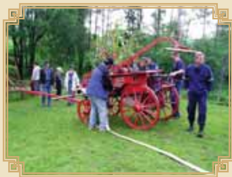
koňská stříkačka z r. 1895

Aby místní sbor hasičstva nezankl, vyzval v roce 1916 starosta obce na pokyn c.k. hejtmanství „všechny zbývající síly mužské v obci“, aby se přihlásili za členy sboru. Celkem se přihlásilo 8 převážně mladíků.