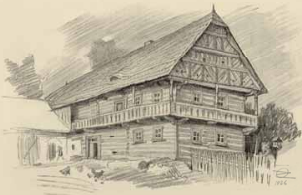
mlýn č.p. 56 v Úbislavicích před úpravou (O. Zemina 1926)