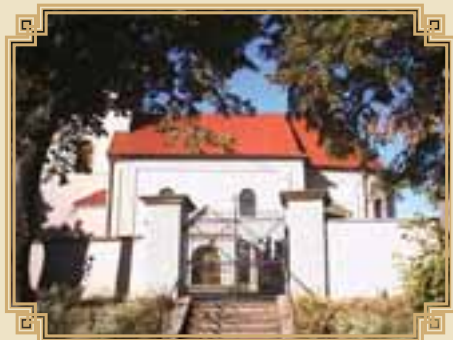
Úbislavický kostel – hlavní brána