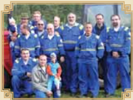
SDH Štěpanice – Česká Proseč

výše, jedná se o ruční stříkačku fy Stra- tílek z r. 1925. Tato je plně funkční, bez renovací a je vždy připravena zúčastnit se nějakých oslav. Dodvkrát se stala účastnicí při dálkové dopravě vody v Roztokách u Jilemnice. Tyto dva poku- sy jsou zapsány do Guinesovy knihy rekordů. Dále vlastníme D8, původní stroj Československých z r. 1941. Stří- kačka byla poměrně velkým nákladem loni renovována a je rovněž plně funkč-