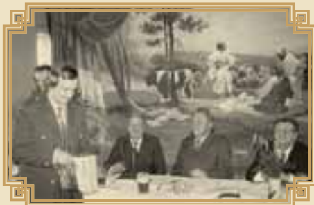
výročka u šormů

mů je za předsednictvem vidět krásná opona divadla Přemysl Oráč s volkem a poselstvem. Kampak se asi podělí?