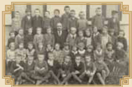
školní foto r. 1938

Do „Mnichově“ vydány šudety Němcům. V této době narukovalo z vesnice 15 mužů.