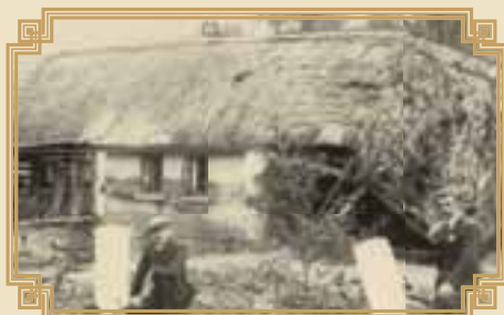
následky povodně r. 1936

26. května velká povodeň, strhané všechny mosty, zatopené chalupy, odplavené chlívký a stodoly.