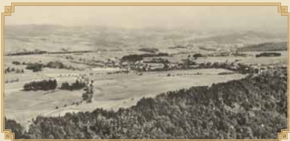
pohled na Škalku a Brdo v polovině minulého století