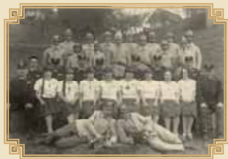
Hasičský sbor Štáve 1930