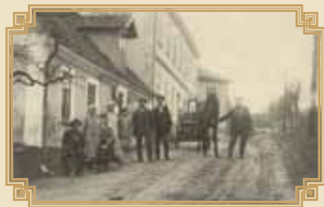
hosпода a kráček, v pozadí fara

Opět nové dodávky obilí. Vypsány nesplnitelné kontingenty v obilí, mléku, máku, bramborách (lidé si obilí a brambory zakopávali do podlah a mezi zdi).