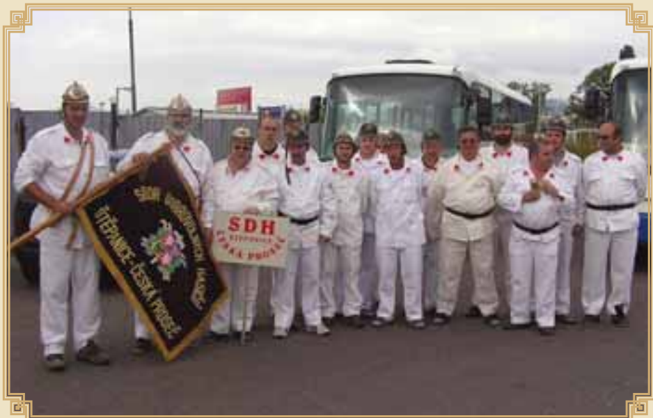
SDH Štěpanice – Česká Proseč