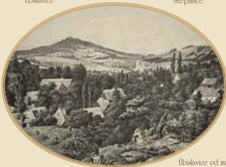
Úbislavice od malíře Tulky