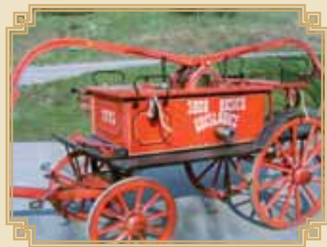
koňská stříkačka z r. 1895

Sbor měl při svém ustavení 35 členů a dva přispívající. Za pomoci obecního výboru a zvláště příspěvků jednotlivých občanů začal obstarávat základní vyba- vení. První stříkačku zakoupila obec.