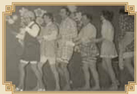
takto bavili pánové dámy při MDŽ