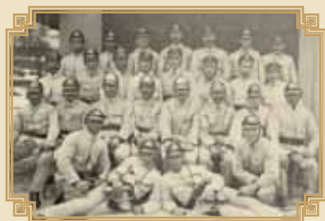
Hasičský sbor Úbislavice

Dne 28. května 1928 se sbor účastnil slavnostního průvodu při slavnosti obnovení pamětní desky prof. Jana Gebauera na jeho rodném domě č.p. 18 v Úbislavicích. Při vlastním odhalení zabezpečoval sbor pohoštění.