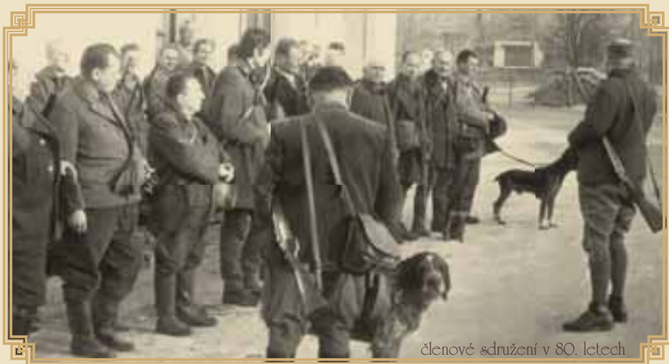
členové sdružení v 80. letech

mů je za předsednictvem vidět krásná opona divadla Přemysl Oráč s volkem a poselstvem. Kampak se asi podělí?