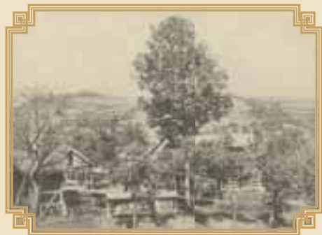
rodný dům Profesora Gebauera

češtiny, roku 1881 řádným profesorem filologie slovanské, roku 1891 děkanem fakulty filozofické Univerzity Karlovy a v roce 1900 i jejím rektorem. Zemřel 25. května 1907.