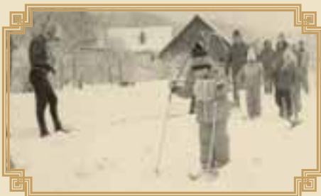
lyžařské závody v 80. letech

V témže roce se uskutečnil 5. denní zájezd do Maďarska, vydařený byl také výstup na Sněžku. V roce 1981 uspořádala TJ 2. sokolské slavnosti. Program byl obohacen o modely řízené rádiem a poprvé v historii seskočili na Úbislavické hřiště parašutisté. Další akcí, která se zrodila v úbislavické TJ nesla