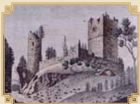
hrad Kumburk od neznámého autora

Kumburk byl postaven někdy na přelomu 13. a 14. století, je tedy stejně starý jako Bradlec. Jeho zakladatel mu dal název Goldenburk, což naši předci začali brzo vyslovovat jako Koldenburk, Kolmburk (1362) a poprvé roku 1394 se v zápisech o hradu objevuje jméno Kumburk.