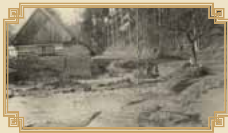
následky povodně r. 1936

Likvidace povodně – některá místa silnice se opravila, na výstavbu mostů nebyly peníze.