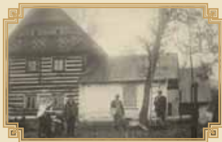
mlýn čp. 1

Mlýn čp. 1 koupil pan Mach, obnovil mletí obilí a začal mít tolik mletí jako nikdy dříve.