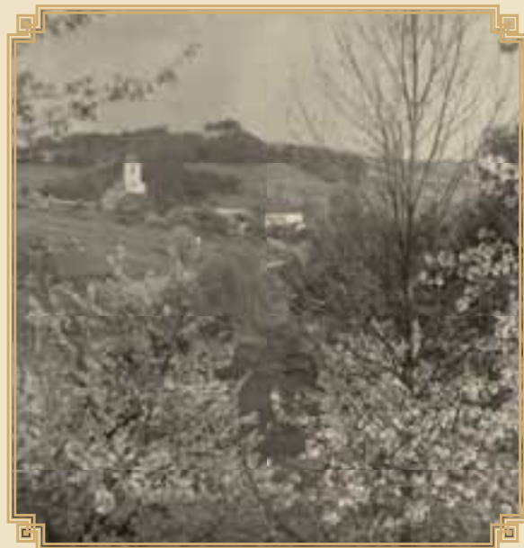
pohled na Oubislavice od Zboží