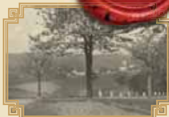
Oubislavice od České Proseče