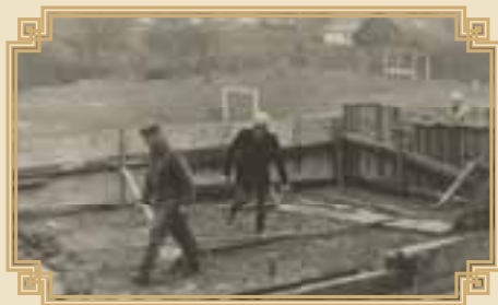
výstavba kabin na hřišti r. 1979

i divadlo patřilo k Šokolu. V roce 1930 byla uvedena první div. hra „Za českou písní“. Další snahu členstva zmařily válečné zásahy a 13. 4. 1941 byla jednota němci zakázaná a jmění zabaveno. I toto zlé období Úbislavičtí sokolové přečkali a výsledky jejich pilné práce byly potvrzeny účastí cvičenců na 11. sletu v Praze. Kulturní činnost Šokola byla rozšířena v roce 1947 o promítání filmů. Jednota, i když nebyla bohatá, zakoupila promítací přístroj. V následujících letech dochází k poklesu členstva a tudíž i k útlumu činnosti. V roce 1965 byla zahájena výstavba víceúčelového hřiště v Úbislavicích. Slavnostní otevření tohoto hřiště proběhlo 24. 6. 1973. Průvod s hudbou došel na hřiště, kde byly zahájeny lehkooatletické a cyklistické soutěže. Další akcí byl 1.ročník branného závodu mládeže za účasti 26 žáků. Znovu začínal být zájem o cvičení žen a dorostenek. V roce 1976 jsou hlavní událostí 1. Šokolské slavnosti u příležitosti 70 let Šokola. 1977 byl založen oddíl stolního tenisu. Do dlouho trvajících komplikací dochází v roce 1979 k zahájení výstavby kabin na hřišti.