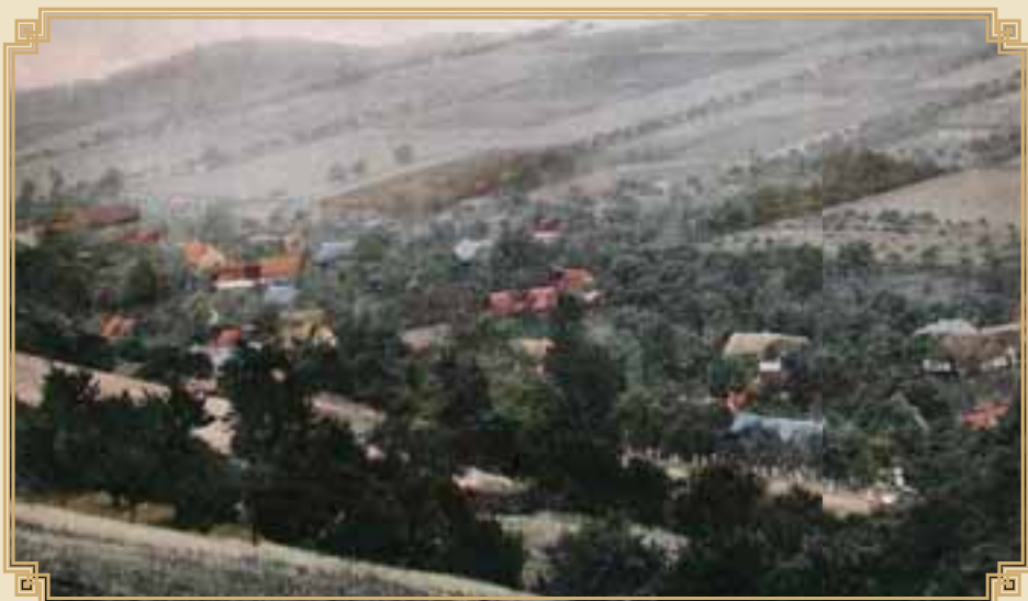
Úbislavice v r. 1914

17. prosince odvážen i zvon „Umíráček“ 7 kg.