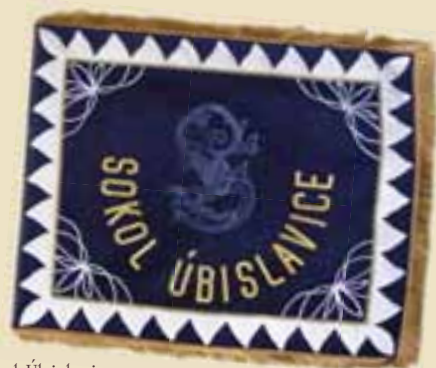
prapor TJ Šokol Úbislavice