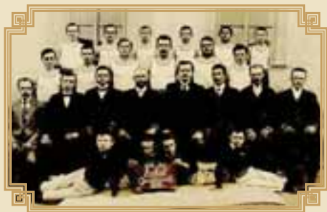
členové sokola r. 1915