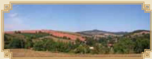
pohled na Štací a Úbislavice